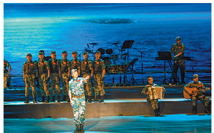
领唱与男声组合《在南沙》