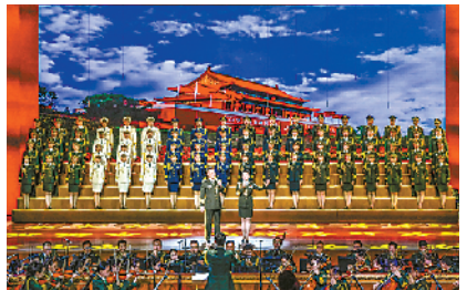
领唱与合唱《不忘初心》